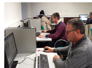
Coup de pouce connexion