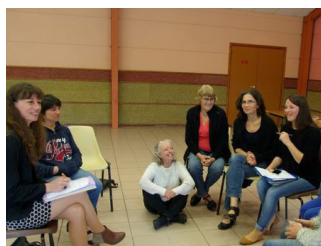
Femmes en agriculture