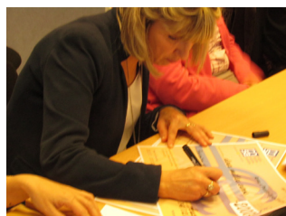
Chèques pour l'APJ